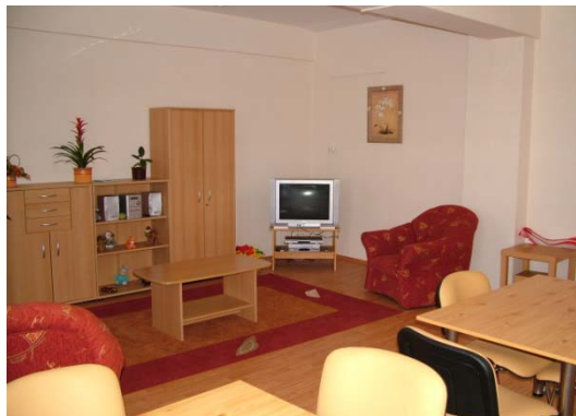
Közös társalgó szoba