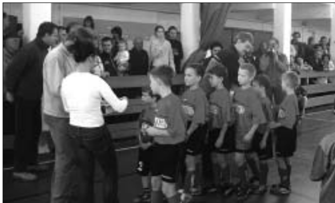
A PULC csapata