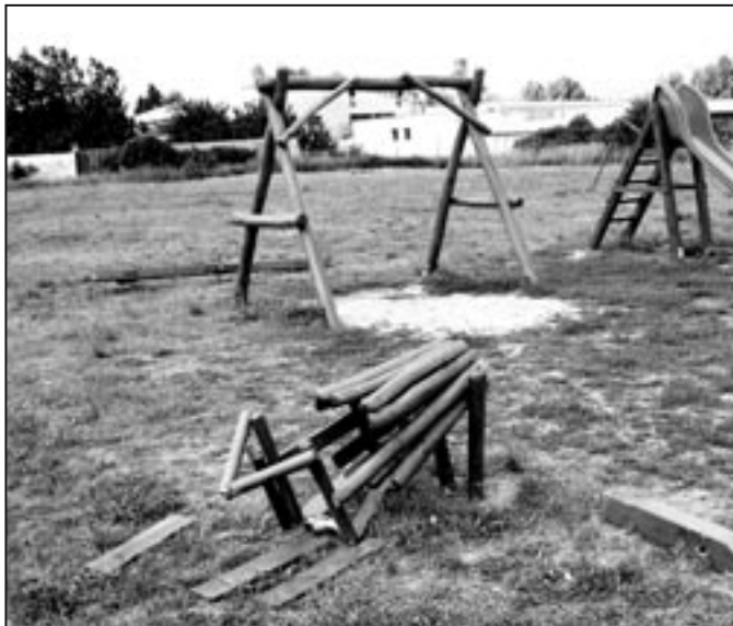
A Régvásártér utcában alig egy esztendeje adták át az EU szabványának megfelelő gyönyörű játszótérrel. A fotó önmagáért beszél.