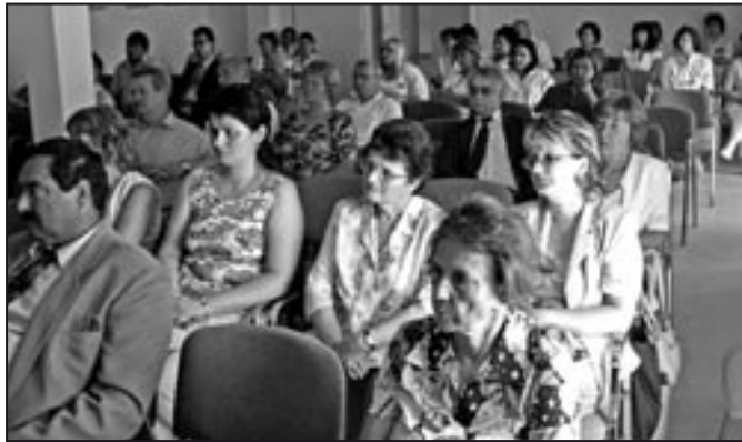
Megkülönböztetett érdeklődés kísérte a testületi ülést