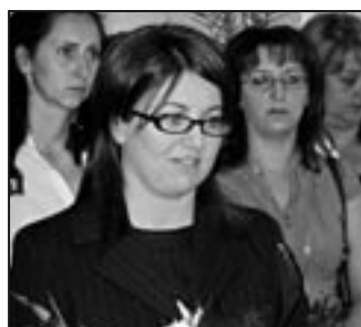
Gál Iлона szakállamtitkár

sát is dicsérve elmondta, hogy: „... Elismerve és tudva, hogy Pásztó nem nagyon örült a reformtörekvések eredményeként megszületett és törvényekben meghatározott törekvéseknek. Ugyanakkor nagyra értékeljük, hogy a város nem vonult a sarkokba duzzogva sírni, hanem felmérte lehetőségeit és a polgármester, valamint az igazgató-főorvos latba vetette minden diplomáciai érzékét... Kérésükre kiemelt figyelmet fordítunk a járóbeteg-szakellátás fejlesztési projektjének a megalkotására. A pásztói polgármester hathatós segítségével alakítottuk ki a pályázati kiírás tervezetét, és az ő közreműködésével, mondhatni sugallatai alapján az országos helyzetet is felmér-