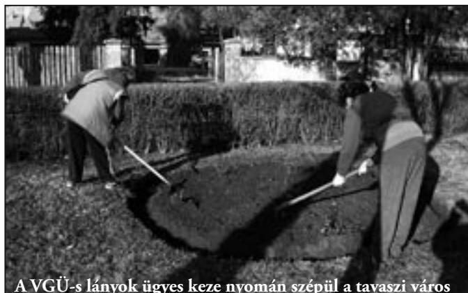
A VGÜ-s lányok ügyes keze nyomán szépül a tavaszi város