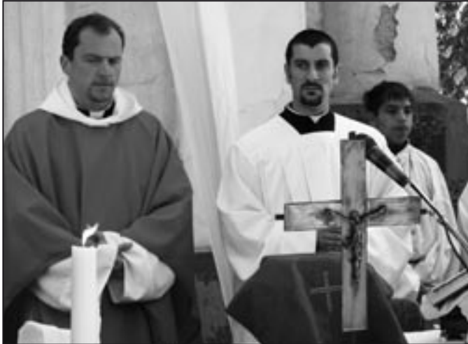
„Áldott legyen a Pünkösdek ünnepe az Úr dicsőségére...”

Az elmúlt két hónap igazán bővelkedett jeles eseményben szűkebb pátriánkban. A tavaszi ünnepek a ránk köszöntő nyári kánikula számtalan olyan programot hozott, melyek méltán kaphatnának helyet lapunk hasábjain. A teljesség igénye nélkül készítettünk egy kis rövid képes visszapillantót olvasóinknak.