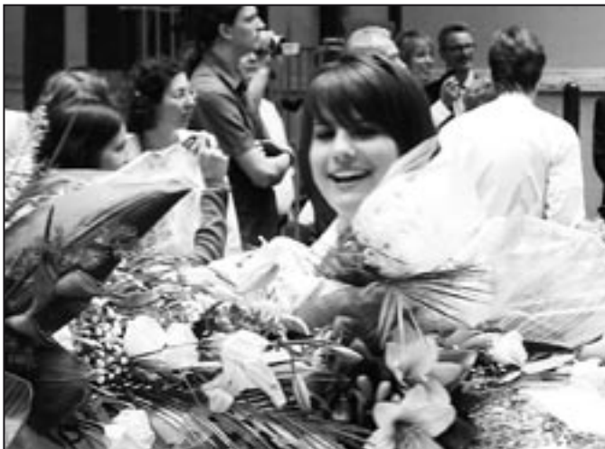
Pásztón másfélszáz „véndiák” búcsúzott az Alma Matertől.