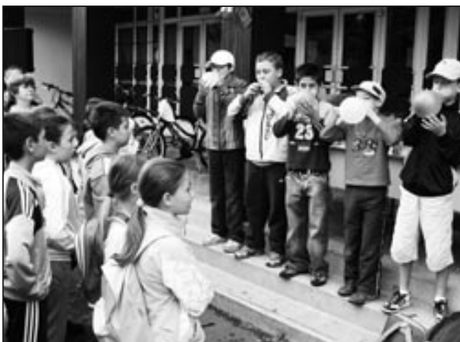
A Dózsában közlekedésbiztonsággal Gyermeknapoztunk.