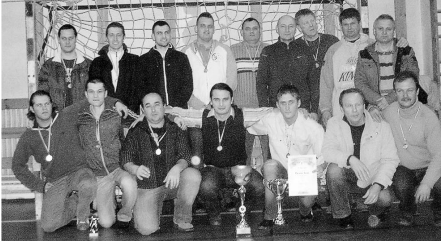
A győztes csapat tagjai

Végeredmény 1. Bauton 51 pont; 2. Jimmy Forever 40 pont; 3. Atlétikó Hintaló 37 pont. Zentai J.