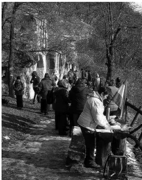
Túrázók a szentkúti remete barlangoknál

A Pásztói Szabadidő Sportegyesület Természetjáró és Természetvédő Szakosztálya február 5-én, szombaton tizedik alkalommal rendezte meg a Szent László 33, illetve kilencedszer a Szent László 15 elnevezésű teljesítménytúrát a Cserhátban. Összesen 358 fő vett részt a két túrán, közülük 151-en a hosszabb, 33 kilométeres távon indultak. A két túra eleje közös volt, Tartól Szentkúton át Nagybárányig tartott, a hosszabbra vállalkozók innen a Garábi-nyerget és a Tepkét érintve a pásztói Tittel Pál kollégiumban értek célba.