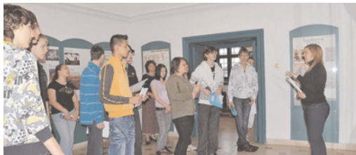
A Palóc Helyismereti Szakkör látogatása a Pászti Múzeumban

ria, Pászti történelmének, szellemi kincseinek, műemlékeinek, neves személyiségeinek, természeti értékeinek és kulturális hagyományainak megis-