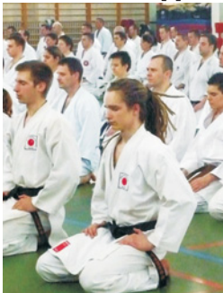
Az edzőtábor résztvevői