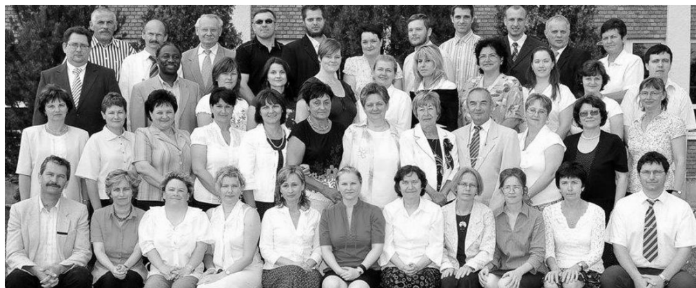
A tantestület a 2010-11-es tanév végén