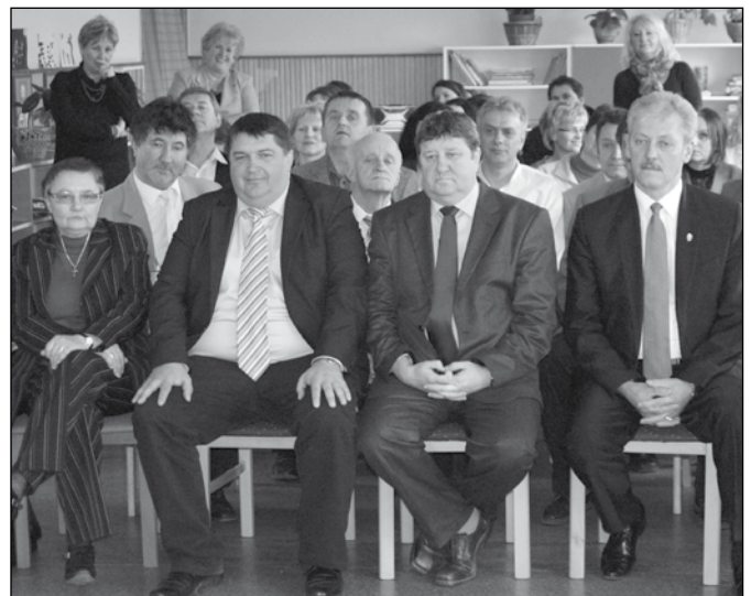
Vendégek a rendezvényen