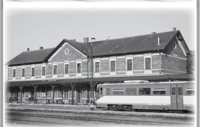
Pásztó vasútállomása a XX. század elején és napjainkban. Nem sokat változott a látkép!