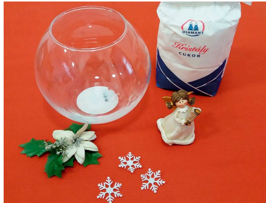
1. Tisztítsuk meg az üveget és töltsünk az aljába kristálycukrot