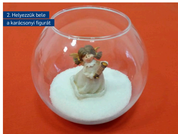
2. Helyezzük bele a karácsonyi figurát