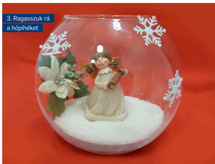
3. Ragasszuk rá a hópihéket